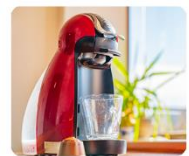
コーヒーメーカー