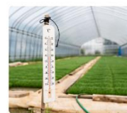
ビニールハウス管理