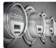
スマートメーター