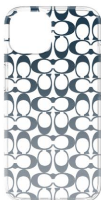
COACH ソフトバンク限定モデル

「COACH」「kate spade new york」からは、SoftBank SELECTION オンラインショップとソフトバンクショップ（一部店舗を除く）でのみ購入可能なソフトバンク限定モデルを発売します。