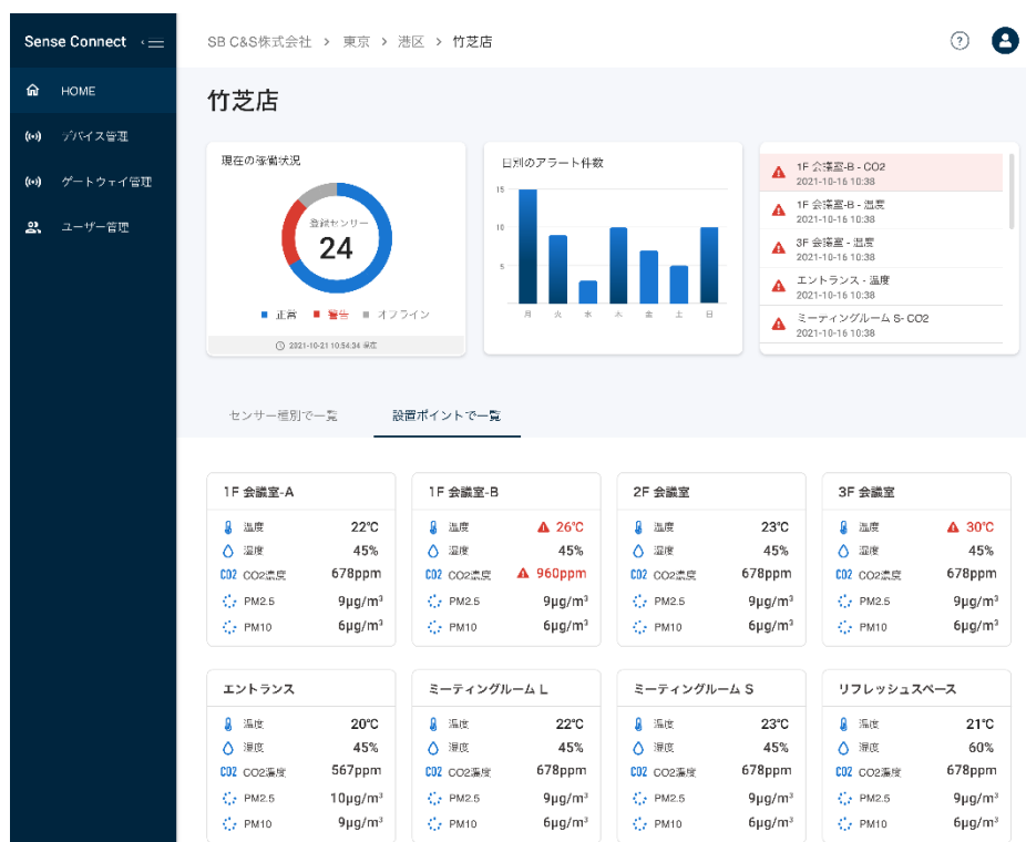
Sense Connect for 環境可視化 ダッシュボードのイメージ画面（複数拠点）