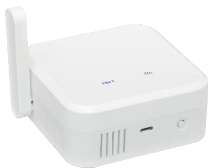
ラトックシステム社 環境センサー

CO2センサーには、スイス・センシリオン社製のCO2センサー「SCD40」を搭載した、国内メーカーであるラトックシステム社の環境センサーを使用しています。CO2センサー「SCD40」は、光音響検出原理を採用したPASens®技術で、コンパクトながら精度が高いCO2濃度の計測が行えるため、安心してご利用いただけます。