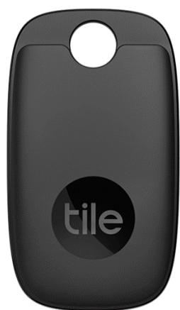
Pro (2022) 電池交換版