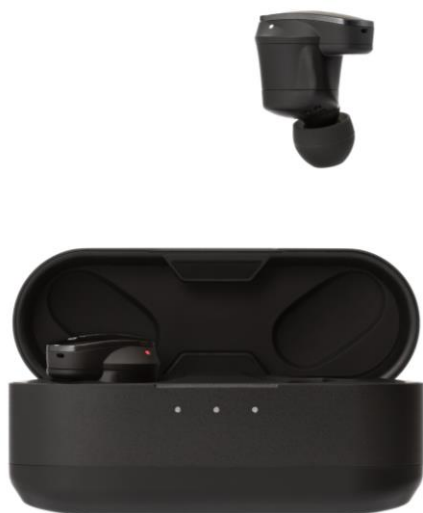
メタリックブラック