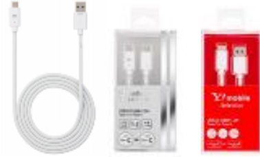
USB2.0 Cable 1.2m Type-C to Type-A