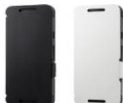
スタンドフリップケース