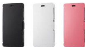
スタンドフリップケース