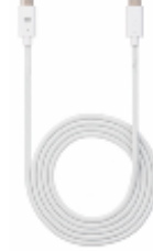
USB2.0 Cable 1.2m Type-C to Type-C