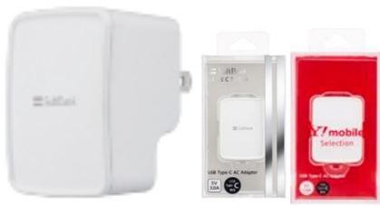
USB Type-C 充電 AC アダプタ