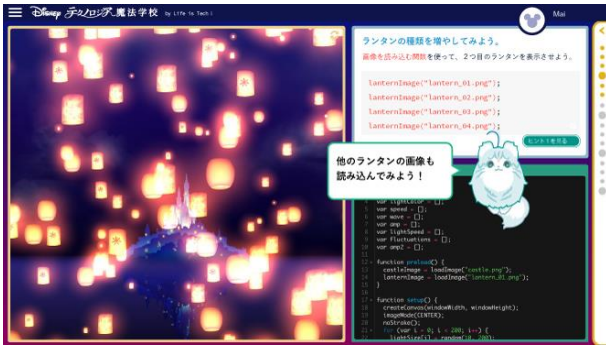
キャラクターが会話形式で学習すべきことをナビゲート