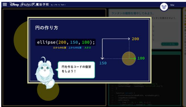
レクチャー部分はわかりやすく図解