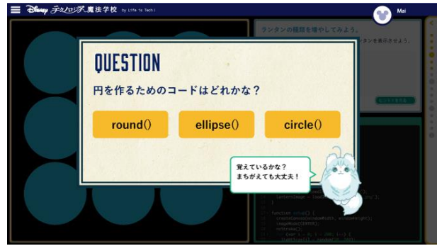
クイズ形式で理解度を確認