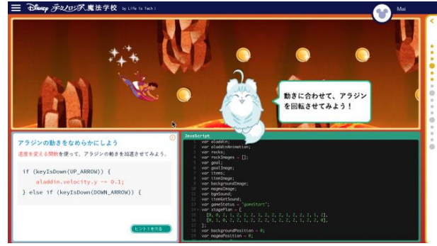
適切な学習情報量や柔軟なレイアウトで 初心者でもストレスなく学習可能