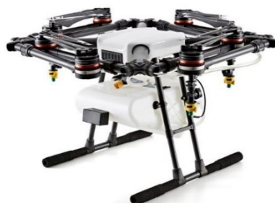
アームとプロペラを折りたたんだ状態の AGRAS MG-1